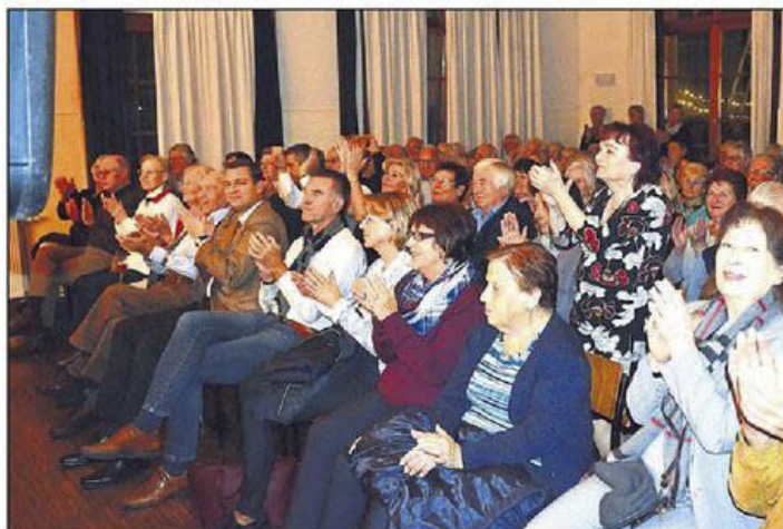
Das Publikum bedankte sich mit viel Zwischenapplaus und lang anhaltendem Beifall zum Schluss.