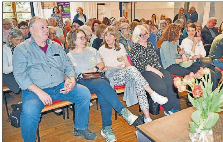
Schon lange vor Beginn der Lesung hatte sich das Publikum eingefunden.